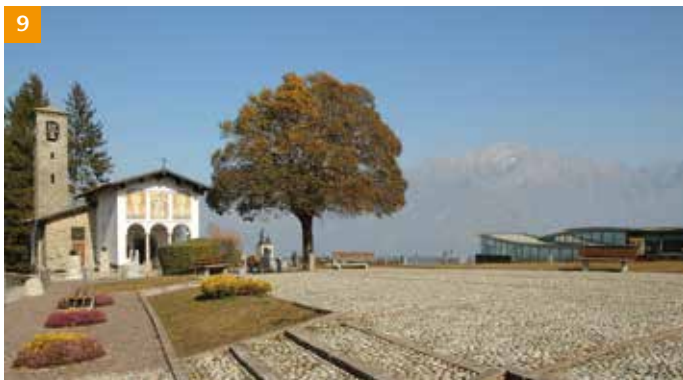
SANTUARIO DELLA MADONNA DEL GHISALLO E MUSEO - Magreglio In Magreglio, known by cycling fans from all around the world. A Magreglio, noti agli appassionati di ciclismo di tutto il mondo.