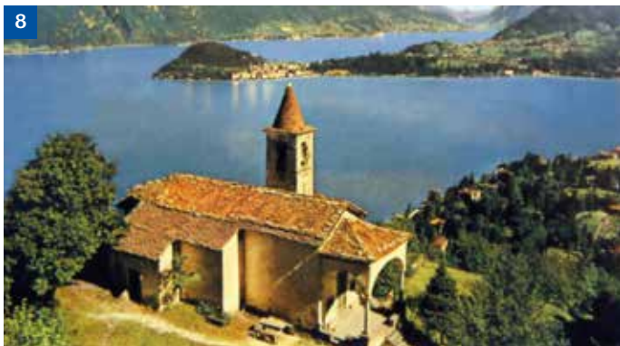
CHIESA DI SAN MARTINO - Cadenabbia One of the most beautiful views of Lake Como. Una delle più belle e suggestive vedute del Lago di Como.