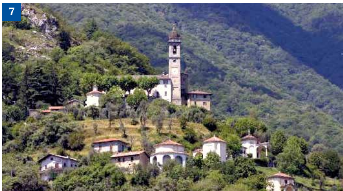
SANTUARIO DELLA MADONNA DEL SOCCORSO - Ossuccio Faith in perfect harmony with the environment. La Fede in perfetta armonia con l'ambiente.